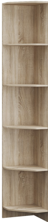
Схема сборки изделия Прихожая «Денвер» Угловое завершение-1 2150*360*360